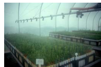
Enraizamiento de estacas de P. taeda en invernadero con sistema de riego de gota fina en la Universidad Estatal de Carolina del Norte