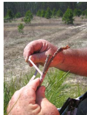
Envoltura de la banda de injertar para fijar la yema al patrón en la copa del árbol.

Los árboles donde se van a realizar los injertos deben ser previamente seleccionados, (Continúa en la página 6, ver Injertos de copa )