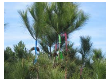
Identificación de clones injertados con cintas de colores.

estróbilos a producir. Si se requiere producir estróbilos femeninos, los injertos deben ser ubicados en la parte mas alta de la copa sobre ramas primarias. Si por el contrario la necesidad es producir estróbilos masculinos, estos se deben ubicar en la parte inferior de la copa, y si se requieren tanto estróbilos masculinos como femeninos, los injertos se deben realizar en la parte media de la copa. Los injertos producen estróbilos femeninos a los dos años, en cambio los estróbilos masculinos son producidos un año después de su ejecución.