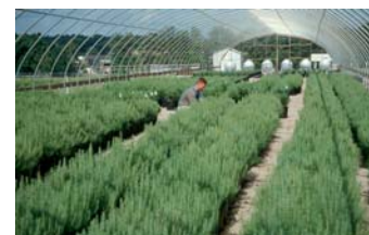
Setos de Pinus taeda manejados en invernadero para la producción de estacas en programa de propagación vegetativa

El enraizamiento de estacas es una herramienta útil para el forestal cuando se logra mantener la condición juvenil, la salud y el vigor del material a propagar a través de podas, nutrición y condiciones de enraizamiento adecuadas.